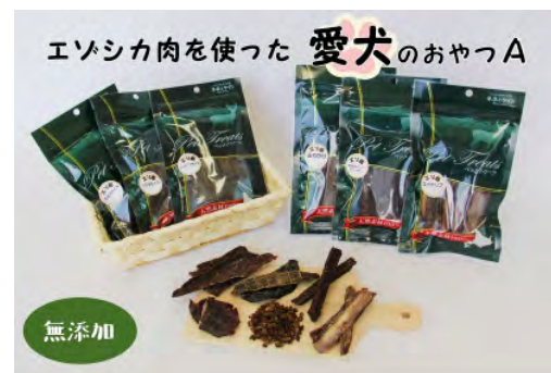
▲エゾシカ肉を使った愛犬のおやつA