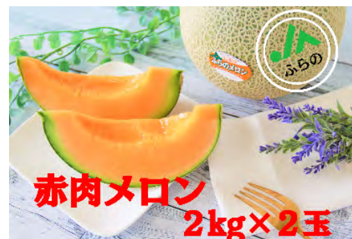
▲ふらの赤肉メロン 2kg×2玉