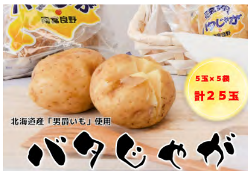
▲バタじゃが5玉入×5袋