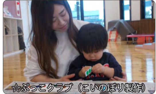
☆ぷっこクラブ（こいのぼり製作）

新年度1回目のぷっこクラブ、新しいお友達も加わりました。1年間親子でたくさん遊ぼうね。