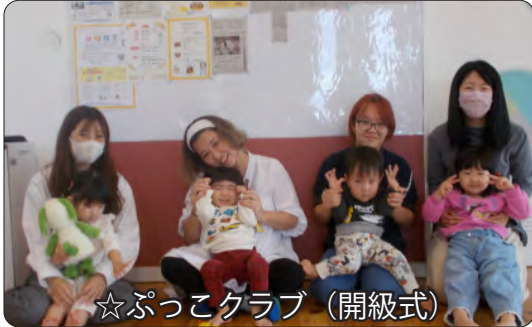
☆ぷっこクラブ（開級式）

6月に入り吹く風が心地よく感じる季節になりました。道端に咲く花は何色かな？白い雲はどんな形かな？ちょっといつもより長いお散歩に出て、いろんな発見をしましょう。