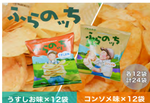
▲ふらのっち うすしお味&コンソメ味セット