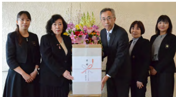
▲国際ソロプチミスト富良野より一味園へ寄贈

国際ソロプチミスト富良野より、社会福祉法人大乗会「一味園」へ寄贈品としてタオル200枚が贈呈されました。同団体は富良野エリアで広く奉仕活動を行っている組織で、これまでも町内の施設へ物品を寄贈いただくなど、継続的なご支援を寄せてくださっています。地域福祉を支える温かいご厚意に心より感謝申し上げます。