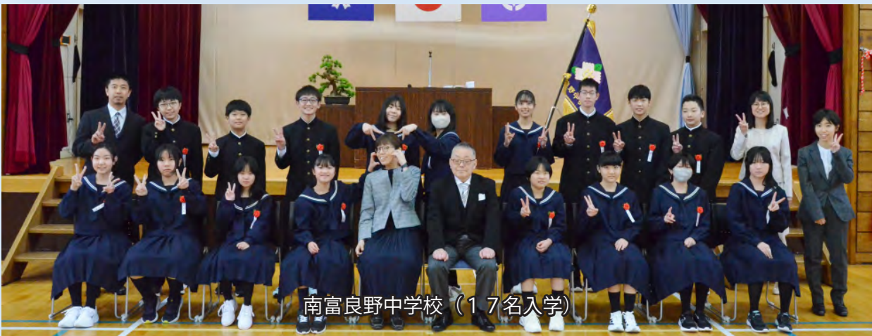
南富良野中学校（17名入学）