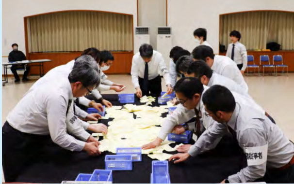
▲保健福祉センターみなくろで行われた開票事務作業