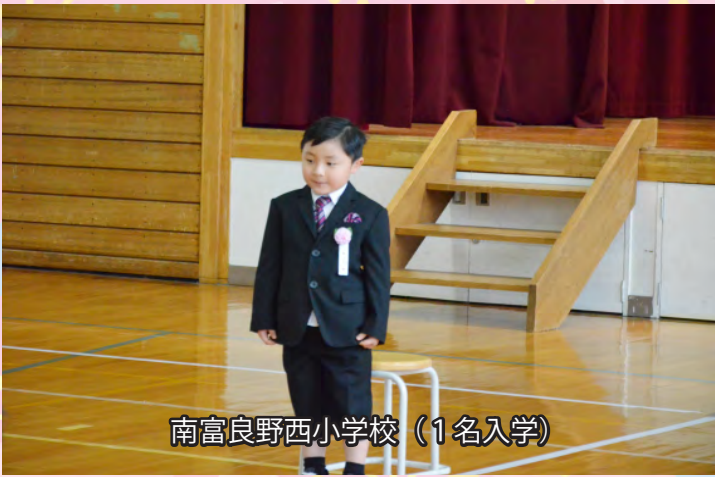
南富良野西小学校（1名入学）

小学校2校に10名、中学校に17名、高等学校に21名が新たに入学し、在校生や保護者の温かいまなざしの中で、新生活への期待を胸に式に臨みました。