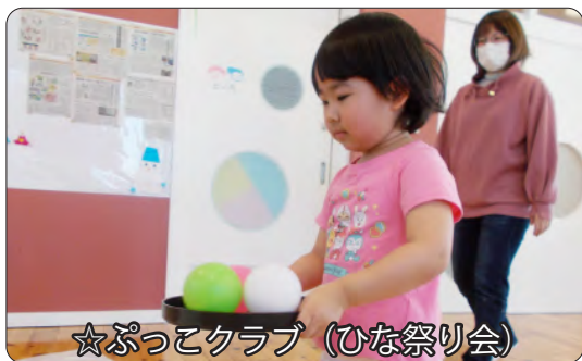
☆ぷっこクラブ (ひな祭り会)

緊張と挑戦の新生活。少しずつ慣れてきたころでしょうか。元気な子ども達の姿を見ると、大人も元気をもらえますね。一緒に遊んだり、たくさんお話をしたり、子ども達の成長を見守っていきましょう。