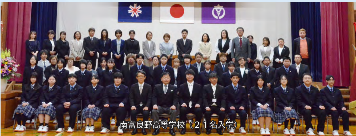
南富良野高等学校（21名入学）