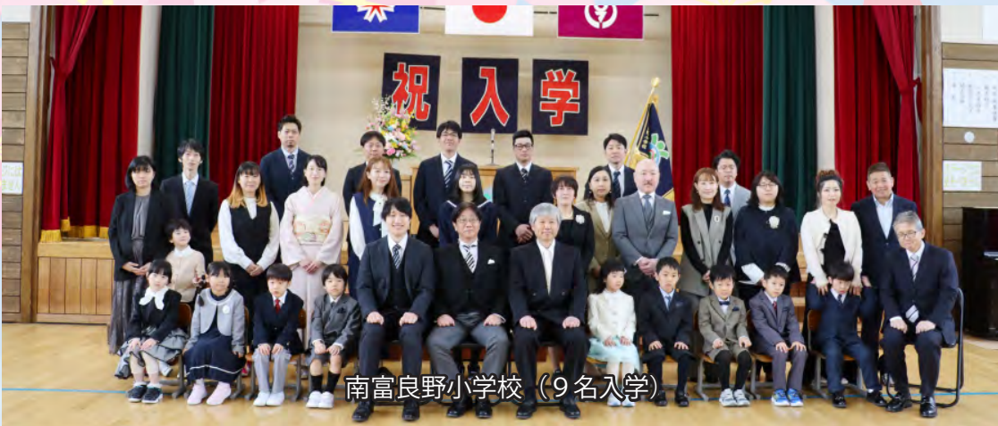
南富良野小学校（9名入学）