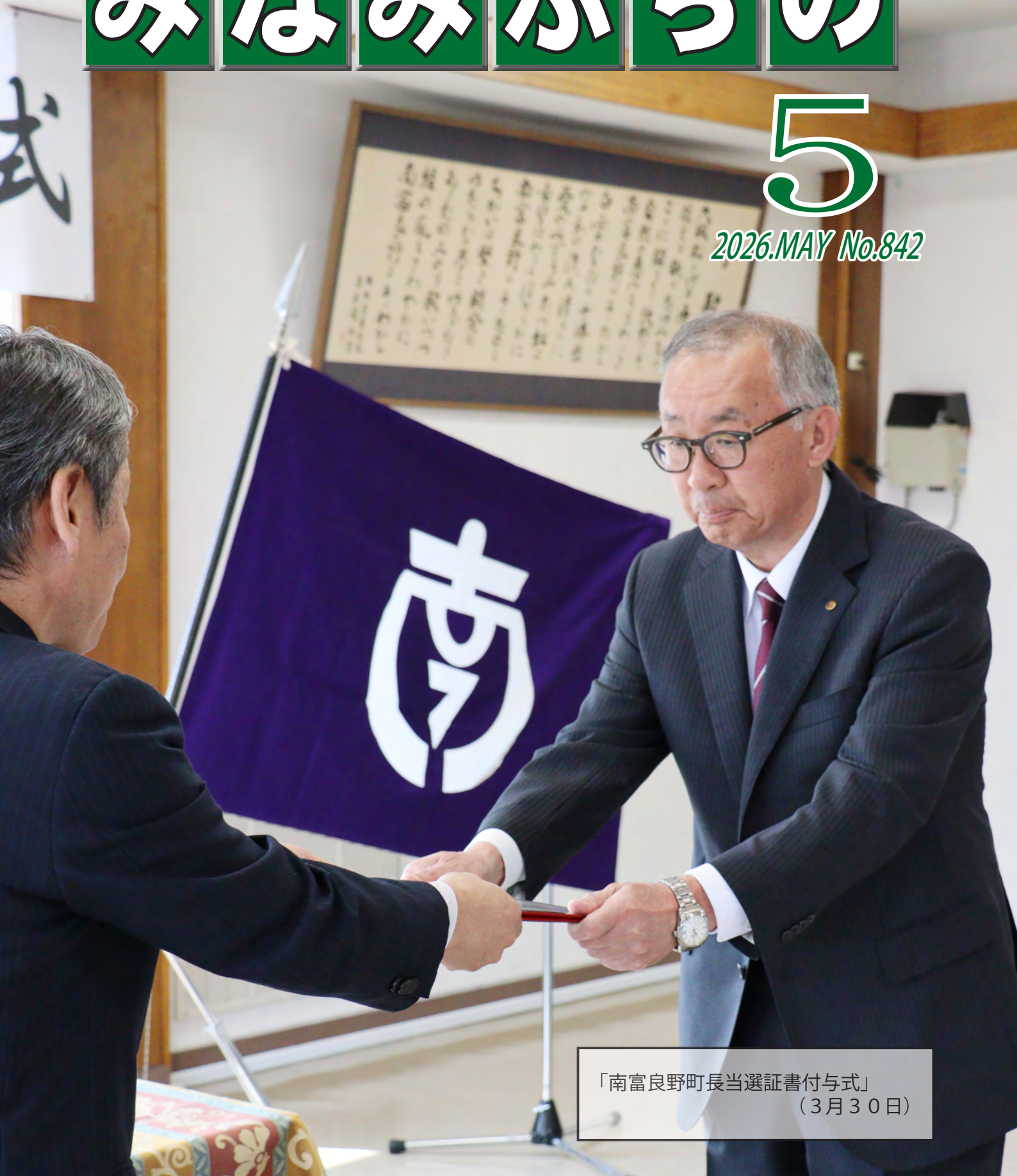
「南富良野町長当選証書付与式」 (3月30日)