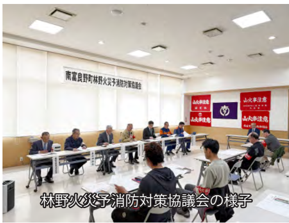
林野火災予消防対策協議会の様子

協議会では、はじめに令和7年度に無火災を達成した町内全5地区の森林愛護組合へ感謝状が贈呈され、その後、予消防対策について協議が行われました。 定めた重点事項は以下のとおりです。