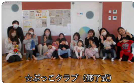
☆ぷっこクラブ (修了式)