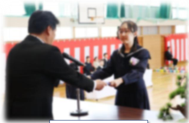
第21回卒業証書授与式