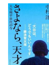
『さよなら、天才 大谷翔平時代の今』