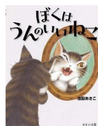
『ぼくはうんのいいねこ』