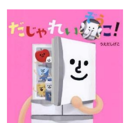
『だじゃれいざうこ!』