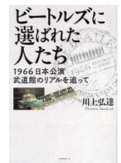
『ビートルズに 選ばれた人たち』