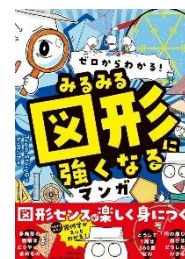
『みるみる図形に 強くなるマンガ』