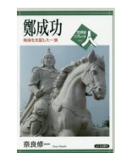
『鄭成功 南海を支 配した一族』