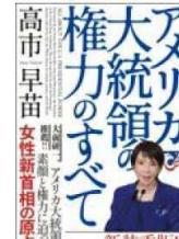
『アメリカ大統領の 権力のすべて』