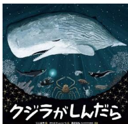
『クジラがしんだら』