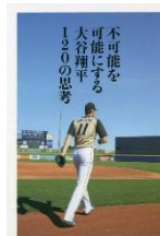
『不可能を可能にする 大谷翔平 120の思考』