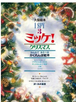
『ミッケ! (3) クリスマス』