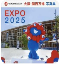
『大阪・関西万博写真集』