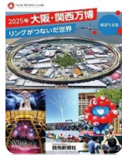
『2025年大阪・関西万博 ～リングがつないだ世界～』