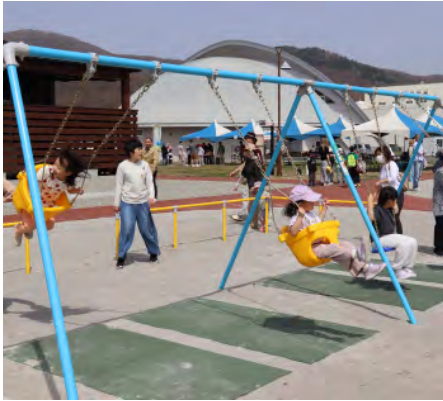
▲幼児用4連ブランコ

「プス」がプレゼントされ、また、南富良野まちづくり観光協会による、「わたあめ」「ポップコーン」「スマートボール」の子ども縁日も開催し、多くの子どもたちが楽しんでいました。公園は11月中旬まで利用できますので、多くの方のご来場をお待ちしています。