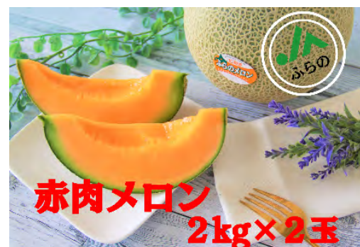
▲ふらの赤肉メロン 2 kg× 2 玉