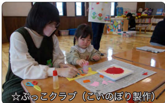
☆ぷっこクラブ（こいのぼり製作）

3組の親子が参加してくれました。それぞれ好きなおもちゃで遊び、みんなで手遊びや絵本を楽しみました。