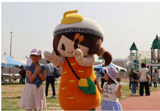
▲南ちゃんとの記念撮影