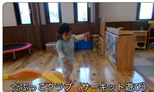
☆ぷっこクラブ（サーキット遊び）

スタンプをペタペタ、はさみでちよきちよき、うろこを飾りこいのぼりが出来上がりました。