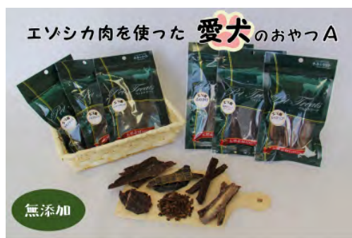
▲エゾシカ肉を使った愛犬のおやつ A