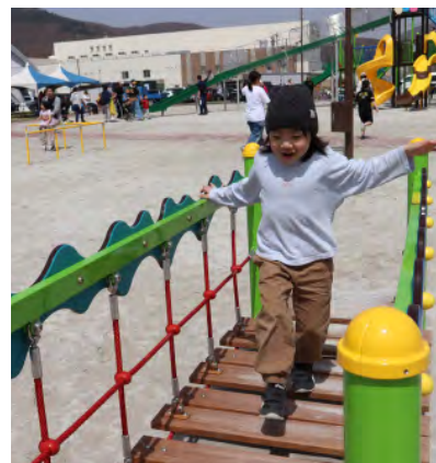
▲インクルーシブ遊具