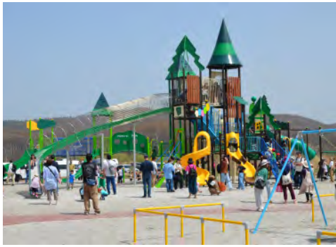
▲公園は11月中旬までご利用できます