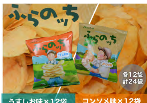
▲ふらのツち うすしお味&コンソメ味セット