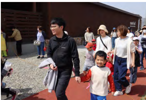
▲オープンとともに多くの来場者

4月27日、道の駅南ふらのに隣接する公園「なんぷアドベンチャーパーク」がオープンしました。人口減少に伴う地域経済縮小への打開と、平成28年8月の大雨災害からの復興を目指し、地域の皆さんからの要望に基づき町民の皆さんや道の駅を利用される方々の憩いの場、親子でのおでかけの場として、幅広い年齢層に愛され、親しんでいただけるよう整備した公園です。