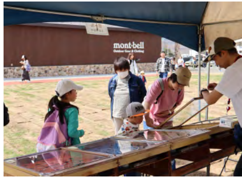
▲観光協会による子ども縁日

「プス」がプレゼントされ、また、南富良野まちづくり観光協会による、「わたあめ」「ポップコーン」「スマートボール」の子ども縁日も開催し、多くの子どもたちが楽しんでいました。公園は11月中旬まで利用できますので、多くの方のご来場をお待ちしています。