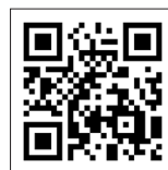
町公式 LINE QR コード