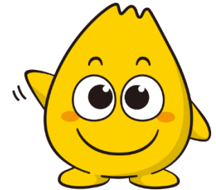
北ガス マスコットキャラクター てん太くん

南富良野町で創出したCO 2 吸収による環境価値（CO 2 クレジット）を、環境保全に向けた取り組みに活用いただく ※南富良野町有林オフセット・クレジット（J-VER）制度を活用