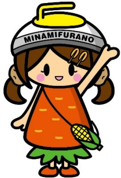
南富良野町 イメージキャラクター 南ちゃん

誰もが気軽にカーボンオフセットに参加できる仕組みを作ること、環境保全の取り組みの理解促進につなげる