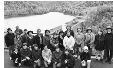
紅葉狩り（令和3年度） ～金山ダム展望台～

「カヌー体験～かなやま湖探検～」 「金山果樹園ベリー摘み体験」 「紅葉狩り～北落合地区・落合地区～」