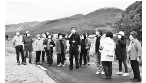
防災学習（令和3年度） フィールドワーク～幾寅・落合地区～