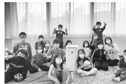
放課後子ども教室「フレンド」 （南富良野西小学校区）

富良野ライオンズクラブ南富良野支部様より放課後子ども教室及び放課後児童クラブの教室運営のため、備品を寄贈いただきました。 寄贈いただいた備品は、子どもたちの健やかな成長のため、活用させていただきます。