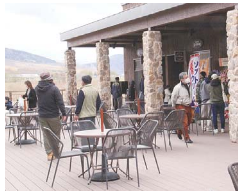
▲フードコートの様子

実している」、「レストランやフードコートも綺麗で多くのメニューがある」、「また利用したい」など感想を話しており、また、町内の方々も「モンベル商品も手軽な価格のものもある」、「町の人も気軽に利用できる場所になれば」などの声が聞かれました。 今後、道の駅を核とした町の賑わい創出事業は、今後3カ年をかけて、複合型商業施設の東側の公園整備と既存の道の駅施設の改修などを行う予定のほか、道の駅周辺には、本年6月末に道の駅と連動したマリオートインテナーナショナルによる宿泊特化型ホテルのオープンや、ラベンダー園の開園など更なる賑わいを期待しています。 ※複合型商業施設及び道の駅を核とした町の賑わい創出事業の概要については、次のおりです。