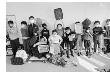
放課後子ども教室「サバナ」 （南富良野小学校区）