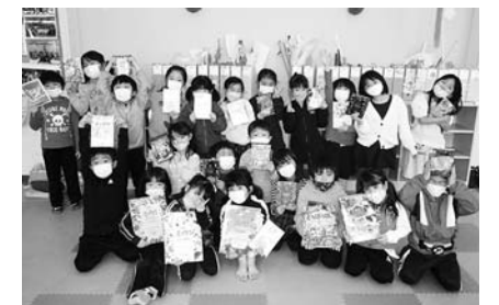
放課後児童クラブ「ジャングルクラブ」 （南富良野小学校区）