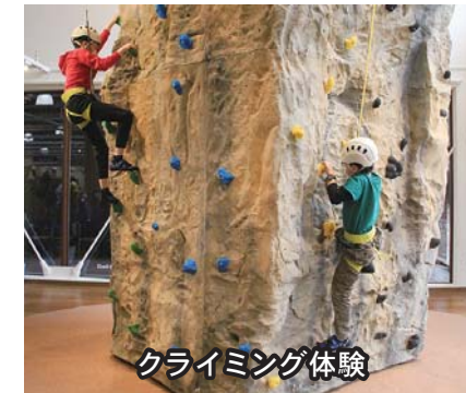
クライミング体験