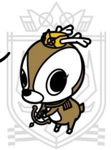
マスコットキャラクター 「ルナちゃん」