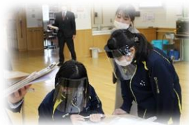
学校教育指導訪問(数学の授業から)