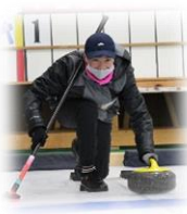
カーリング・空手授業