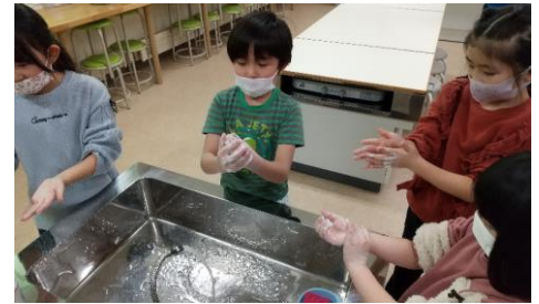
手洗い体験会(低学年)

3学期の登校日も、残り20日を切りました。新型コロナウイルスの感染がさらに増えて、まん延防止重点措置も延長となりましたが、感染防止対策をとりながらの教育活動を日々継続しております。幸いなことに、南富っ子は現在元気いっぱいです。ご家庭での感染防止に配慮した生活の成果であり、大変感謝いたします。今後もよろしくお願いたします。