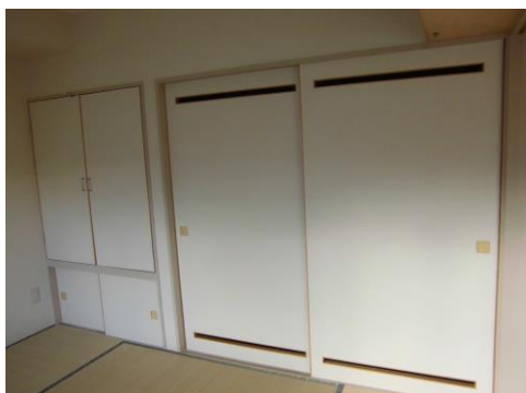
( 室内 )