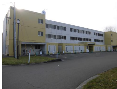
( A棟外観 )