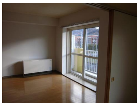
( 室内 蓄熱式電気暖房機付 )