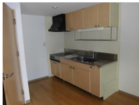
(キッチン IHクッキングヒーター付)