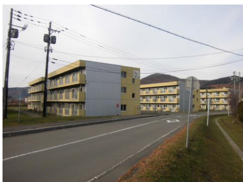
( A団地 )