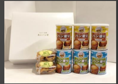
No.2-58 防災備蓄セット 寄附額 11,000円

北海道ふらの産のもぎたてとうもろこし（イエロー種）をすばやく調理し、美味しさをまるごと真空パックしました。原料のとうもろこしは、厳選されたものを使用しています。レンジで温めていただくとおいしくお召し上がりいただけます。北海道の夏の味覚をお楽しみください☆