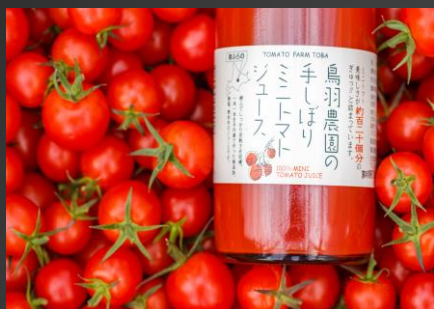
No.2-2 「手しぼり」ミニトマトジュース735g×2本セット 寄附金額 11,000円

夏でも朝と夜の寒暖差が激しい南富良野町で育ったメロンはとても甘くてジューシーです。一度食べると、また食べたくなる！そんなメロンを是非一度ご賞味ください。 ※毎年7月中旬から8月下旬発送 ※沖縄・離島への発送不可