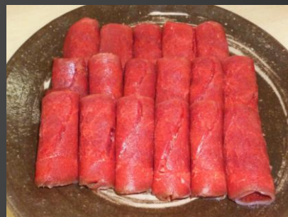
No.2-20 エゾシカ肉のスライス2種食べ比べお試しセット 寄附金額：14,000円

年間出荷頭数70頭と、希少価値の高いふらの大地和牛を焼肉用にスライスしました。徹底した健康管理の元、定期的採血しビタミン値を測定した上でビタミンコントロールがされており、出荷5か月前よりもち米を食べて育ったふらの大地和牛です。