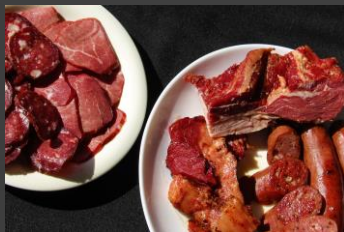
No.1-24 エゾ鹿肉加工品セットA 寄附額 10,000円

自然豊かな北海道で育ったエゾシカ肉をHACCPを取得した自社工場製造、加工しています。柔らかくてくせがなくあっさりとしたスモークハムとサラミはおつまみとしても、焼くとジューシーなベーコンとソーセージはおかずとしてもお楽しみいただけます。