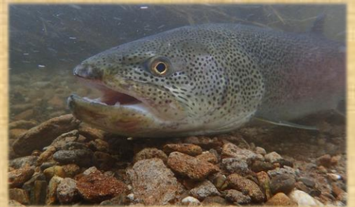
【国内最大級の淡水魚 イトウ】

町では豊かな自然の象徴であるイトウが健全な状態で資源維持していることに多面的な価値を見出し、これを町民共有の財産として、生物多様性を保全し次代に継承することでまちづくりに寄与することを目的としております。