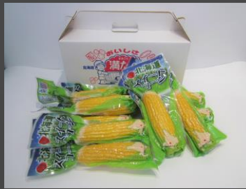
No.1-3 北海道スイートコーン10本 寄附額 10,000円

南富良野町で製造しているヒット商品、「パタジャが」をたっぷりお楽しみいただけるセットです。北海道富良野が育てた最高の「男爵いも」を丸ごと使用し、北海道産のバターとドッキング！自然のおいしさをそのまま真空パックしました。バターが染み込んでいるので電子レンジで温めてすぐ食べられる手軽さが魅力です。