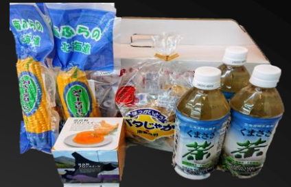
No.1-1 満たんセット 寄附額 10,000円

農業を一切使わず育った果実と、北海道産てんさい糖のみを加え果実を潰さないよう丁寧に作ったジャムのセットです。それぞれの甘味や酸味が全く違うので是非食べ比べてみてください。パンだけではなくパナライスやケーキ、お肉料理にもよく合いますので、お試しください。