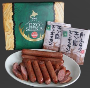
No.2-19 エゾシカ肉の焼肉セット 寄附額 14,000円

自然豊かな北海道で育ったエゾシカ肉のジンギスカンをHACCPを取得した自社工場製造しています。高タンパクで低カロリー、鉄分とミネラルが豊富な柔らかくてとっても美味しいエゾシカジンギスカンと、くせがなくあっさりとした仕上げたエゾシカフランクのセットです。