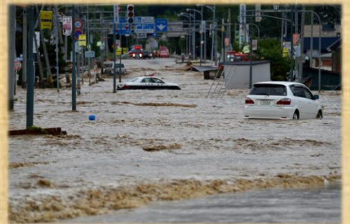
【平成28年災害当時の様子】