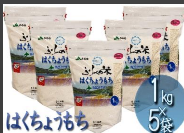
No.1-37 はくちょうもち5kg 寄附額 10,000円

寒暖差の大きい気候により、冷めてもやわらかさが長持ちする、精米もち米です。蒸し器がなくても炊飯器で調理で炊けるので、一般家庭でもおいしく召し上がれます。