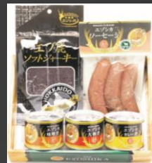
No.1-23 エゾ鹿肉ギフトセット(ソーセージ付) 寄附額 10,000円

くせがなく低脂肪、栄養価も高く、高たんぱくなうえ、鉄分が多く含まれている100%天然のエゾシカ肉を、HACCPを取得した自社工場で手軽に食べられるよう加工したセットです。