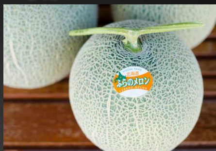
No.2-10 南ふらの産赤肉メロン1.6kg×2玉 寄附金額 12,000円

自然豊かな北海道で育ったエゾシカ肉をHACCPを取得した自社工場製造、加工しています。人間が食べても体に良い、安心安全な美味しい鹿肉を、いろいろなタイプのペット用フードにしました。今までと一味違う、体に良いおやつを大切なペットに是非どうぞ。