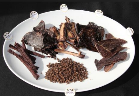
No.1-26 エゾシカ肉を使った愛犬のおやつA 寄附金額 10,000円

自然豊かな北海道で育ったエゾシカ肉をHACCPを取得した自社工場製造、加工しています。人間が食べても体に良い、安心安全な美味しい鹿肉を、いろいろなタイプのペット用フードにしました。今までと一味違う、体に良いおやつを大切なペットに是非どうぞ。