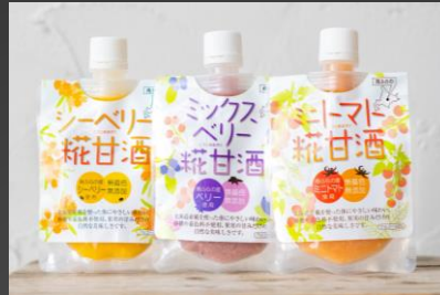
No.2-6 糀甘酒3種飲み比べセット 寄附額 35,000円

南富良野町自慢の鳥羽農園のミニトマトジュース80mlの飲みきりサイズを40本セットにしました。鳥羽農園では寒暖差や日照時間など天候に左右されながらも大切に育てられたとってもあまーいミニトマトを無添加、無塩、無加水の100%ミニトマトのみで作られているジュースにしました。80mlの中にミニトマト14個分のおいしさがギュッと詰まっています。