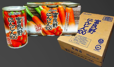
No.1-38 にんじんジュース30缶セット 寄附金額 10,000円

鳥羽農園のミニトマトジュースは、極力農業に頼らず丁寧に大事に育て上げた完熟のミニトマトを、一本一本手作業で無添加、無塩、無加水のジュースにしています。この1本でミニトマト約120個分のおいしさがぎゅっ！と詰まっています。とっても甘いので！贈答用にもお使いください。