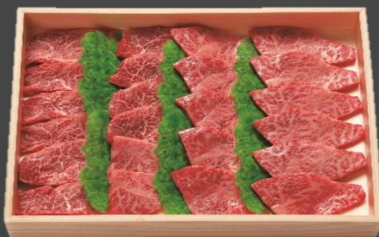
No.1-32 ふらの大地和牛 焼肉用 寄附金額 10,000円

年間出荷頭数70頭と、希少価値の高いふらの大地和牛を焼肉用にスライスしました。徹底した健康管理の元、定期的採血しビタミン値を測定した上でビタミンコントロールがされており、出荷5か月前よりもち米を食べて育ったふらの大地和牛です。