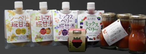
No.2-3 鳥羽農園のおすすめセット 寄附額 11,000円

南富良野産の野菜や果実をたっぷり使用し、砂糖や着色料は一切使用していない米糀甘酒です。糀と果実のみで作っているので、糀の甘さと果実の爽やかな酸味が広がり、甘酒が苦手な方にも飲みやすくなっており、トマト、シーベリー、ミックスベリーが10個ずつ入ったセットです。