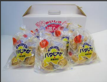
No.1-2 パタジャがが5玉入×5袋 寄附額 10,000円

南富良野町の鳥羽農園でつくられたミニマトジュース、ミックスベリーソース、3種の米糀甘酒、ドライミニマトオリブオイル漬けのセットです。全て南富良野産の果実をたっぷり使用し、砂糖や着色料は一切使用していません。これら南富良野の大地の恵みをセットでお届けいたします。