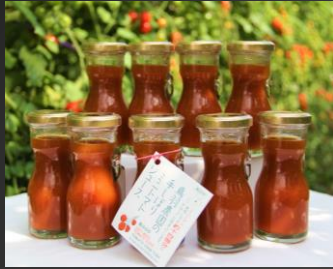
No.2-47「手しぼり」ミニトマトジュース 寄附額 45,000円

南富良野町で採れた原材料を使い、南富良野町で生産・加工した食品の詰合せです。特にパタジャがは有名でお土産にも喜ばれています。体に良くまささ茶と共にいろいろな南富良野町の味をお楽しみください。 ※一部内容が変更となることがございます。