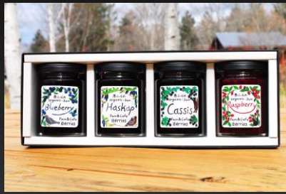
No.1-43 4種のベリー手作りジャムセット 寄附額 10,000円

農業を一切使わず育った果実と、北海道産てんさい糖のみを加え果実を潰さないよう丁寧に作ったジャムのセットです。それぞれの甘味や酸味が全く違うので是非食べ比べてみてください。パンだけではなくパナライスやケーキ、お肉料理にもよく合いますので、お試しください。