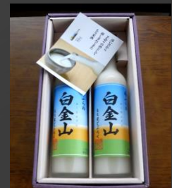
No.2-11 白金山 寄附額 12,000円

寒暖差の大きい気候により、冷めてもやわらかさが長持ちする、精米もち米です。蒸し器がなくても炊飯器で調理で炊けるので、一般家庭でもおいしく召し上がれます。