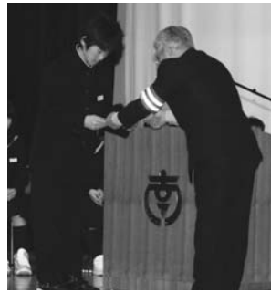
優秀作品の表彰を受ける中学生