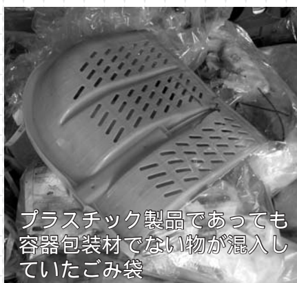
プラスチック製品であっても容器包装材でない物が混入していたごみ袋