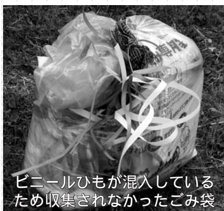
ビニールひもが混入しているため収集されなかったごみ袋

収集不可の張り紙がされた場合は、今一度分別しなおしてから出してください。ほとんどが、異物（プラスチック以外の物）や汚れた物が入っています。